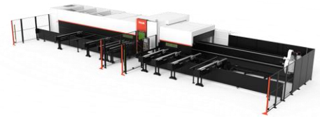
●FG-400 3次元レーザー加工機