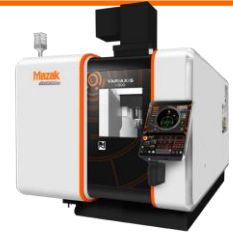
●VARIAXIS i-500 5軸マシニングセンタ