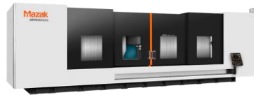
●SVC2000L/120 高速送りロングテーブル立形マシニングセンタ