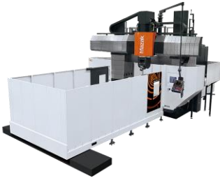
●VERSATECH V-140N 大型5軸加工門型マシニングセンタ