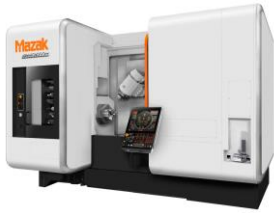
●INTEGREX i-200 5軸制御複合旋盤