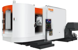
●INTEGREX i-630V 大型5軸制御立形複合旋盤